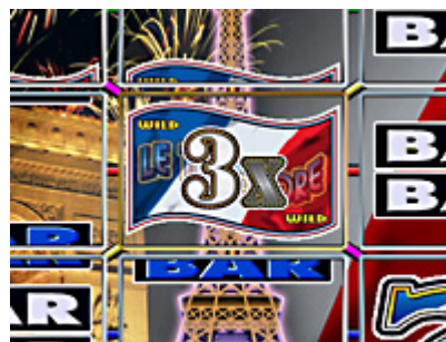
図3 フィーチャー数が追加され継続します。