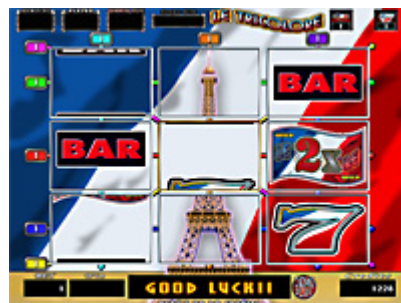
図1 エッフェル塔が完成すれば…

さらにフィーチャー中にうれしい「フラッグ(旗)」停止確定予告機能も搭載。軽快なリズムに乗って、頂上(ピーク)を極め、夢の「324」ゲーム継続をめざしましょう!