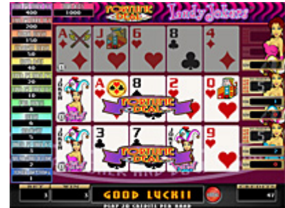
図1 2つ以上同時にフリーに入る事も!

フォーチュンディール・レディージョーカーズは、2枚のジョーカーを含む54枚のデッキを用いた5スタッドポーカー(引き直しができないポーカー)です。1ハンドに2枚のジョーカーが出現するか、ジョーカーとハートのエースが同時に配られるとフォーチュンディール(フリーゲーム)に突入。もちろん2ハンド、3ハンドともフォーチュンディールに突入することも。ディール時に口笛が鳴れば、ジョーカーを2枚含むハンドがあるか、2ハンド以上フォーチュンディールに突入します！(図1)