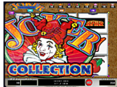
ジョーカーが横切ると...?

そして、このジョーカー予告にはさらなる発展型が...? 写真といえばアレ!目立ちたがりジョーカーならではのパフォーマンスです。