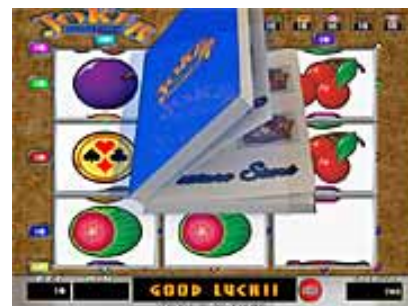
アルバムの写真がいつもと違うと...?

アルバムを開いた瞬間、普段とは違う写真が貼られていたら期待大! フリースピン中にジョーカーが追加される可能性UPです!!